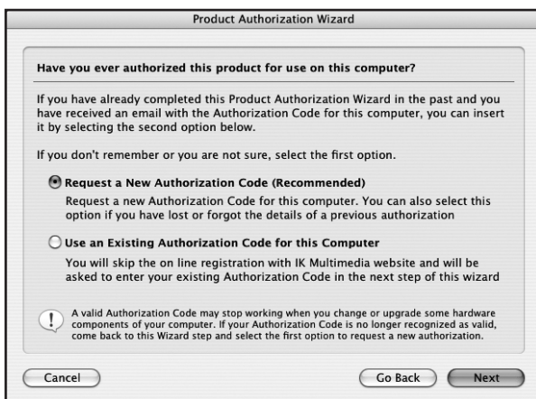
Step 3. Authorization/Reauthorization