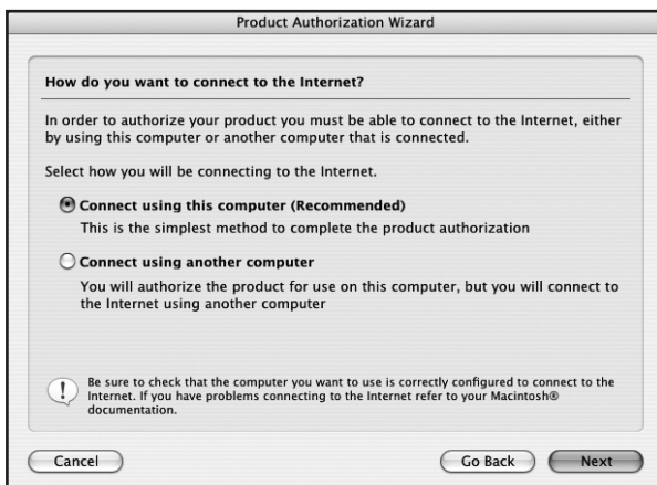
Step 4. Connect to the Internet