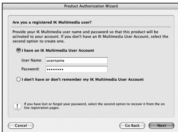
Step 5. User Name and Password

作成済のアカウント情報を思い出せない場合は、下記「ユーザーエリア」画面の「Forgot your Password?」欄に登録Emailアドレスを入力して「Remind」をクリックしてください。登録Emailアドレスに「User Name」と「Password」が再送信されます。