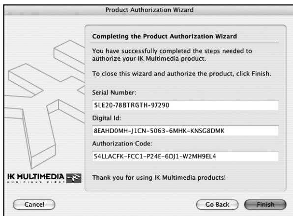
Step 8. Authorization Completed