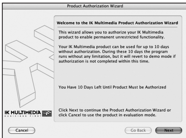
Step 1. Wizard introduction